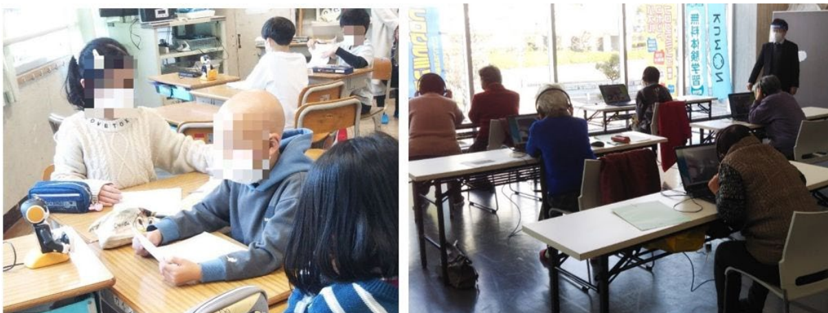
図：小学校での実験の様子。小学校に設置した CA8 台（図左）に対して、別の場所（モール内の貸会議室）から高齢者が遠隔操作を行った（図右）